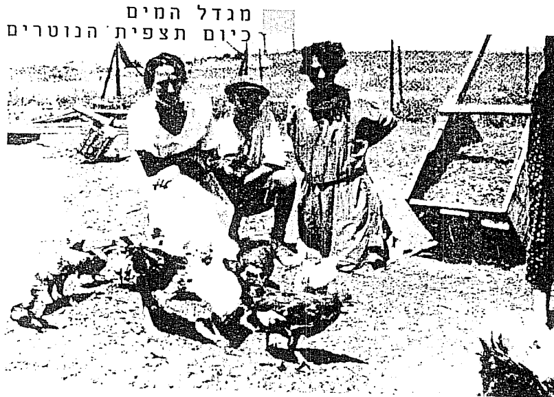
מגדל המים כיום תצפית הנוטרים